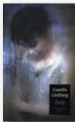
Mannen die vrouwen haten Kwade Wil Zusje Een plek onder de zon Boeman