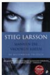
Stieg Larsson Karin Fossum Camilla Läckberg Liza Marklund Unni Lindell